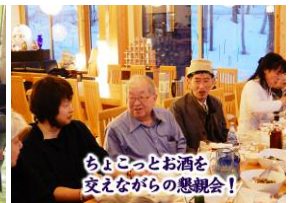
ちよこっとお酒を交えながらの懇親会!