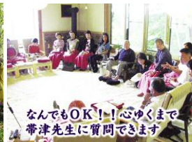
なんでもOK!心ゆくまで帯津先生に質問できます