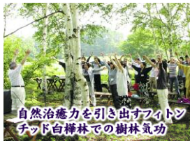
自然治癒力を引き出すアイトンチッド白樺林での樹林気功